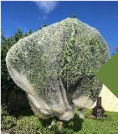
د حشراتو د نیولو جال

جلا کول غوره دي: د میوو پوښل، کڅوړې یا لستونې د میوو پوښلو لپاره وکاروئ وروسته د مېوې کرده ایستلو چې د کوینز لینډ میوو مچ په میوو او سبزیجاتو کې د هڅو اچولو مخه ونیسي. جال د میوو سره لمس کولو ته مه برېږدئ.